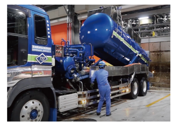
回収した吸引物は、ハッチを開けてダンパアップして排出します。