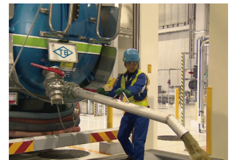
現場状況や積載物の種類によって、レシーバータンクの後部から圧送排出を行います。