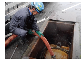
大量の汚泥を強力な吸引でスピーディーに吸い上げ、安全かつ効率的に運搬します。